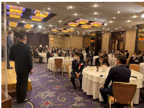
【懇親会：乾杯・挨拶】